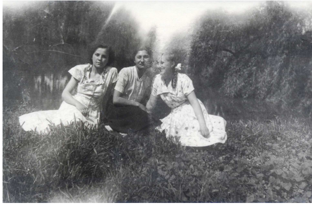
Lányok a kastélypark tavának partján

koronájáról „templomfenyvesnek” hívtuk. Aljnövényzete ritkás volt, kúszó félcserjével benőtt terület. Úgy tűnt nekem, hogy nemcsak az emberek, hanem a fák is tudtak viselkedni. S ami fáj az embernek, hogy továbbélnek minálunknál.”