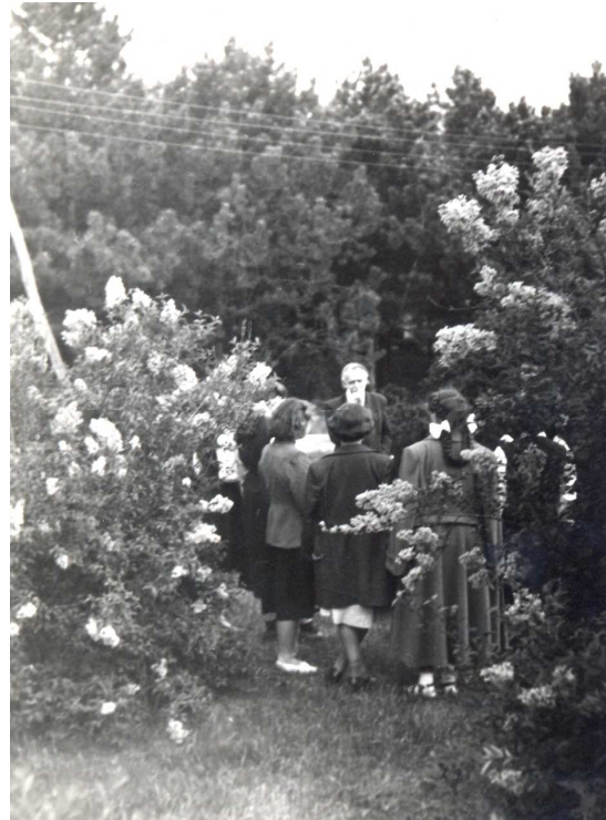
Kodály Zoltán éneklő gyerekekkel a tarhosi parkban

lebbentek felém kergetőző árnyak. Suttogtak a levelek, talán beszélgettek a fák, de ez titok maradt, az emberi fül nem fogta fel a hangok értelmét. A park oltalmában így is enyhe és puha volt minden. A fűben billegő kanálfülű nyulak lapultak. Az éjszaka paplana alatt aludt a tanyavilág. Biztonságosan nyitottam ki a szobám ajtaját. Tarhoson eszembe sem jutott félni. Tartoztam valakikhez, és ez még ma is, mint emlék, csodálatosan