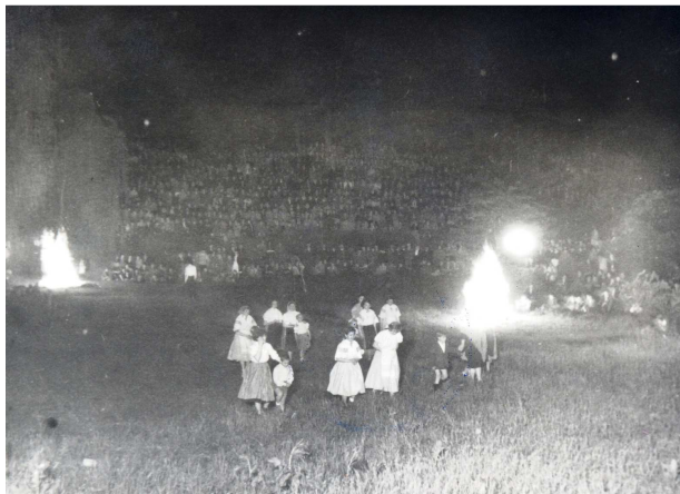
A Zenepavilon átadásának napját tábortűz és a Kőmíves Kelemenné című ballada előadása zárta

„Mentem lefelé a salakúton, s ahogy elhaladtam a fenyves mellett, a homályban nem