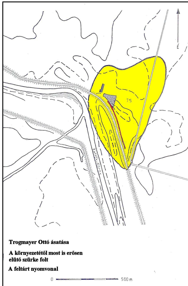
2002. évi Povád-zugi feltárásunk helyszínrajza, sárga színnel jelölve a tiszai kultúra lelőhelyének (Békés 75.) feltételezhető teljes területét

Mivel a gát mellett vízelvezető csatorna ásását tervezték, 2002. július 22. és október 14. között megelőző régészeti feltárást végeztünk a Békés-povádi őskori lelőhelyen. Megelőző feltárásunk a vízelvezető csatorna 800 méter hosszú nyomvonalára korlátozódott, illetve az 1,90 méter szélességűre tervezett csatorna mindkét oldalán 1-1 méter ráhagyással 4 méteres sáv állt a rendelkezésünkre. A nyomvonal a gát mellett húzódó út és a szántóterület között futott, mindkettőből kiszakítva 1-1 kis csíkot. A feltárt terület nagysága hozzávetőlegesen 5600 m 2 -re tehető. Munkánk során 69 régészeti objektumot: 62 gödröt (házalapok, tárolóhelyek, szemétgödrök, kemencemaradványok) és 7 sírt tártunk fel.