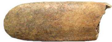
Nagyobb állat bordacsontjából készült simító-szerszám

tünkben is a változatos feldolgozó munkára utalnak. Az agyag-nehezékek mérettől és formától függően szövőszék vagy halászháló tartozékai lehettek. Az álló szövőszékek használatát az „in situ” talált (használat helyén összeomlott) maradványok bizonyítják. Ilyet pl. Dévaványa-Réhelyen is feltártak.