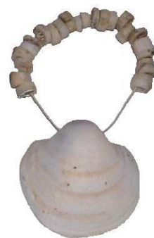
A sír nyaklánc

A sírból előkerült kerámiák díszítetlenek. Az 1. számú edény tetején feküdt az egyik obszidián és a kovapenge, valamint a kőbuzogány töredékei is. Kova- és obszidiánpengék adásának a szokása ismert a késő-neolitikumból, mint áldozati szokás. Párhuzamát Vésztő-Mágorról ismerjük, amikor a szentélyben, egy áldozati tálban kova- és obszidiánpenge feküdt két trapéz alakú véső és égett állatcsontok mellett. A csontváz nyakcsigolyái körül 23 darab spondylus gyöngy került elő. A spondylusból készült nyaklánc mindenütt megtalálható a késő újkőkori temetőkben kagylóval, vagy kagyló nélkül. Mind a spondylus, mind a mandulakagyló a Föld-közi-tenger vidékéről származik.