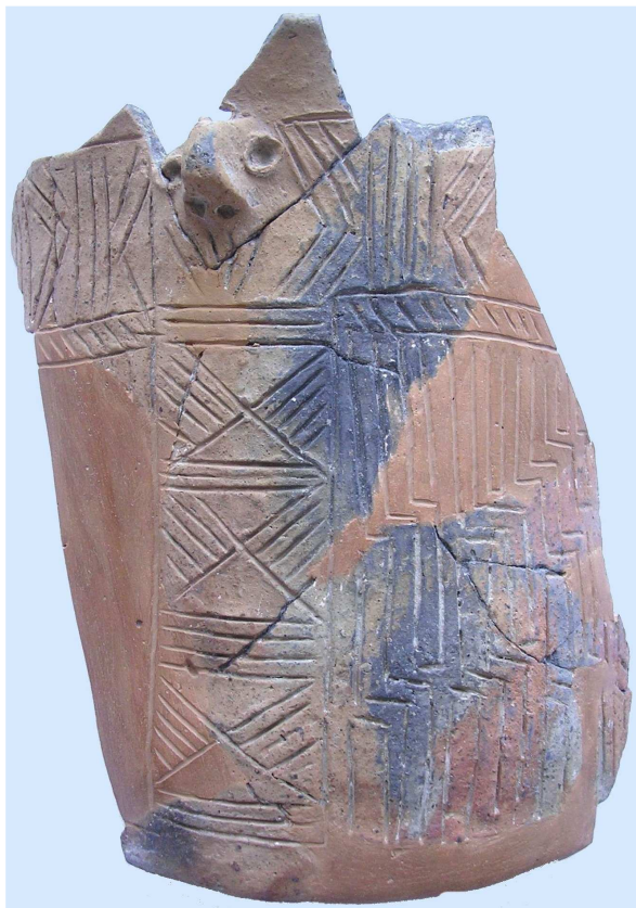
A kultúrára jellemző, feltehetően áldozati célokra készült „arcos edény” töredéke.

festékrögök megtörésére használt zúzókövet is találtunk, melyek szertartási célt szolgálhattak.