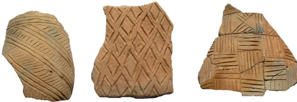
Néhány szövetmintás kerámiatöredék a povádi ásatás anyagából

A textilszövés számtalan lehetőséget nyújtott a geometrikus minták variálására, ami abból az egyszerű technikai tényből adódott, hogy ha két fonal derékszögben találkozott egymással és színük eltérő volt, már eleve ritmikusan ismétlődő minta jött létre. A művészi érzék megkívánta az egyszerű minták bonyolítását. Bár sem textilszövetek, sem színes gyékények