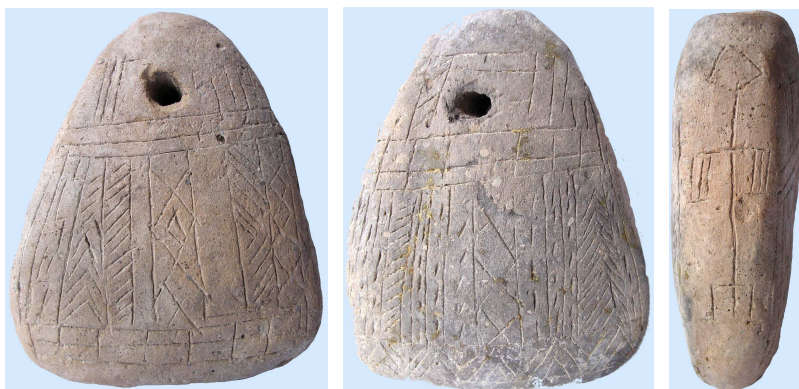
A povádi feltárás legjelentősebb lelete ez a – a magyarországi leletanyagban egyedülálló – szinte teljes felületén díszített kisméretű szövőszéknehezék . Legfőbb értékét az egyik élére karcolt stilizált emberábrázolás jelenti.

tünkben is a változatos feldolgozó munkára utalnak. Az agyag-nehezékek mérettől és formától függően szövőszék vagy halászháló tartozékai lehettek. Az álló szövőszékek használatát az „in situ” talált (használat helyén összeomlott) maradványok bizonyítják. Ilyet pl. Dévaványa-Réhelyen is feltártak.