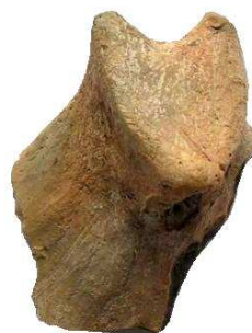
Az állatfejet utánozó edényfűl

Az agyagedények díszítésében fennmaradt művészi tevékenység nemcsak az iparművészet legegyszerűbb módjaként – díszítőművészetként – jelentkezett az újkőkorban, vallásos jelentősége is volt. Agyagidolok kisebb töredékei (lábak, melyek lehetnek ember alakú edény lábai is) feltárásunkon is előkerültek, valamint egy, valószínűleg állatfejet formázó edényfűl.