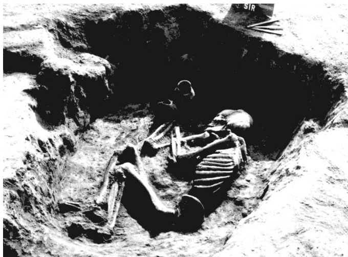
A legalább 5000 éves férfi sírja

közi-tenger vidékéről származó mandulakagylót találtunk, melyek egy nyaklánc részei lehetnek.