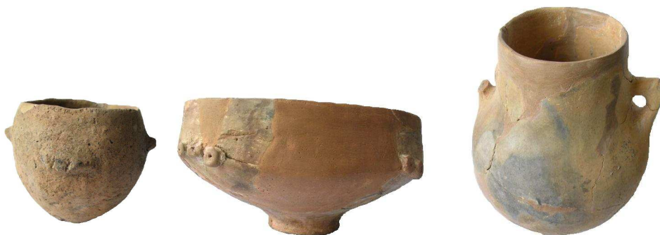
Edényke, bütyökdiszes tál és folyadéktárolásra használt füles fazék a feltárásból

nem maradtak meg Magyarországon, az úgynevezett textil- vagy fonatmintás edények e díszítésmód számos változatát megőrizték. Az edény készítője előtt tehát elméletileg korlátlan lehetőségek álltak, amikor egy edényt meg akart formálni, a gyakorlatban azonban a korlátozó tényezők olyan erősen érvényesültek, hogy egy-egy kisebb-nagyobb közösségnek kialakultak a jellegzetes formái és díszítő mintái , vagyis létrejött a típus és a stílus . Az edények díszítésére leginkább vörös és sárga földfestéket használtak, de előfordul a fehér és fekete színezés is. Festett töredékek feltárásunkon is előkerültek.