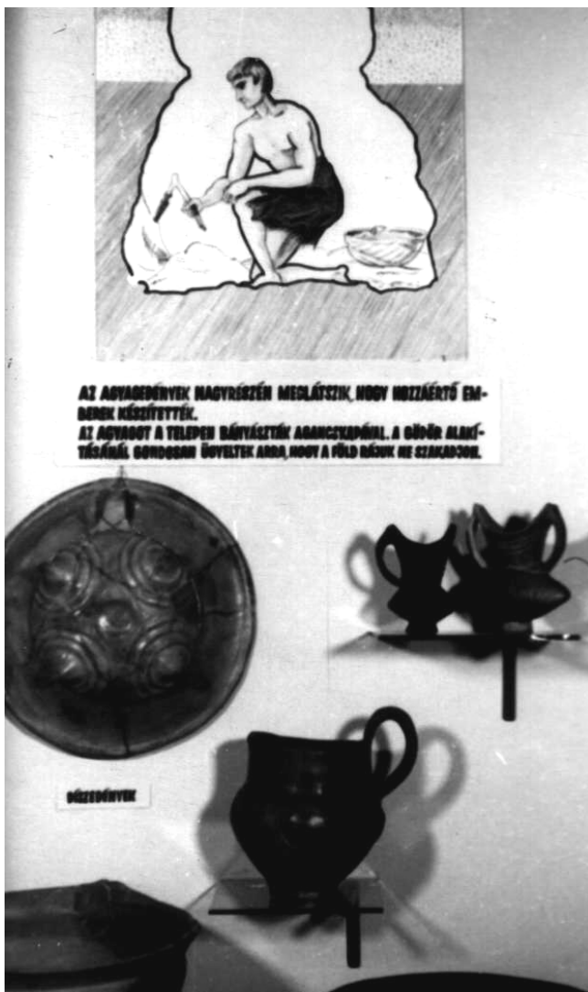
4. Részlet az 1970-es „Várak Békés határában” című kiállításból