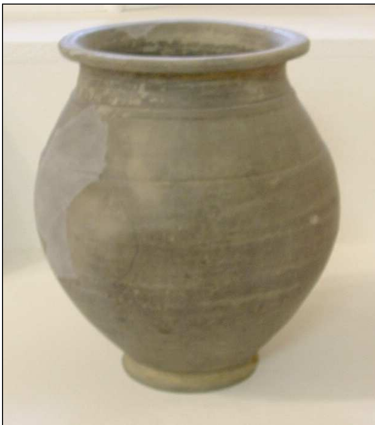
7. Szarmata edény a povádi ásatásból