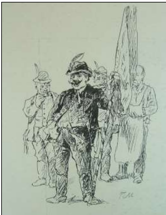
A kortesek – Jantyik Máttyás rajza

Békés megyéből összesen 6 képviselő kerülhetett az országgyűlés alsóházába, ebből 4 a