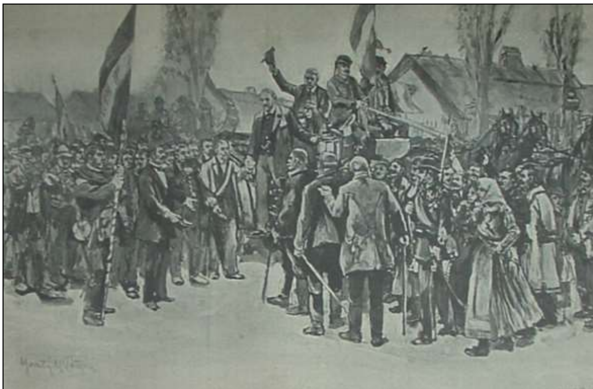
A képviselőjelölt fogadtatása – Jantyik Mátyás festménye